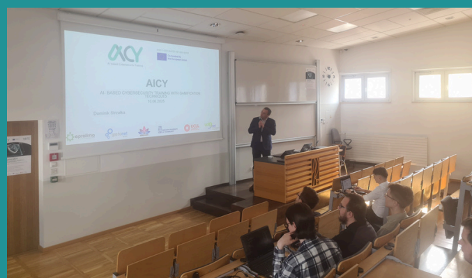
10.06.2025, Politechnika Rzeszowska, Rzeszów, Polska

Zdjęcia z konferencji pilotażowych w całej Europie