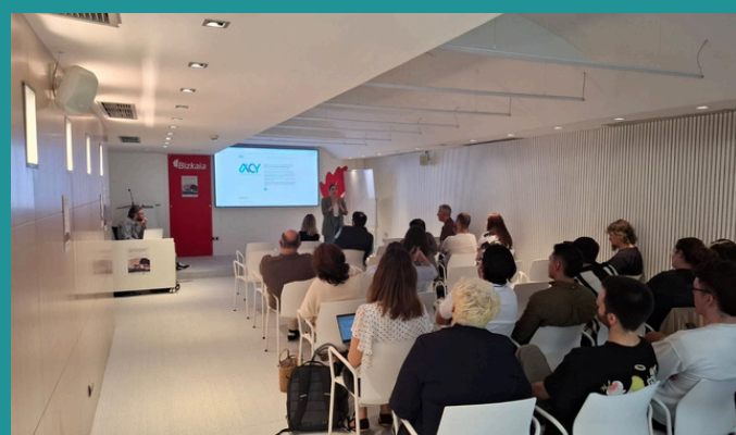
09.06.2025, Sala auditorio de Beaz, Bilbao, Hiszpania